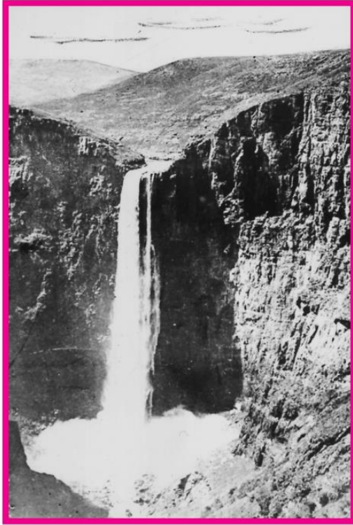
MALETSUNYANE FALLS (194 metres) Lesotho

ఈ సువార్త పత్రం కంప్యూటర్ తో అనువదించబడింది. మీరు భాషను సరిదిద్దవచ్చు లేదా మెరుగుపరచగలిగితే, దయచేసి info@angp.co.za లోని కార్యాలయాన్ని సంప్రదించండి