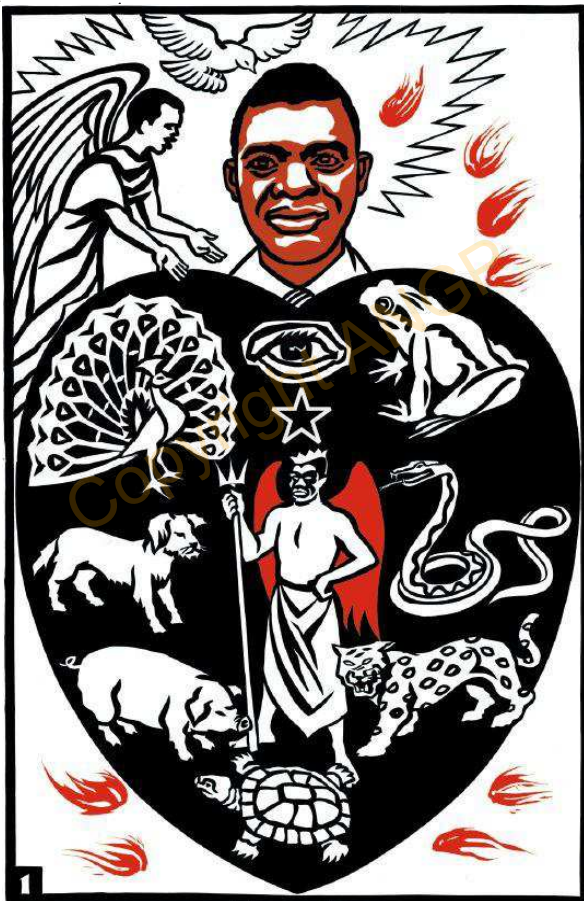
MFONYINLI MƏ DI BƏMÖNLE

Mfonyinli yi da yuadenii taneyseləvölə, nii mə y'adwenle yəe yuade yuade, Adam inlā mə yuade yi nu sunzuma bé di izō hene, na ənwōnlame akənnə ine yuade niēni bebele nwo felekōwula i manle ne, y'ahōnlene āli.