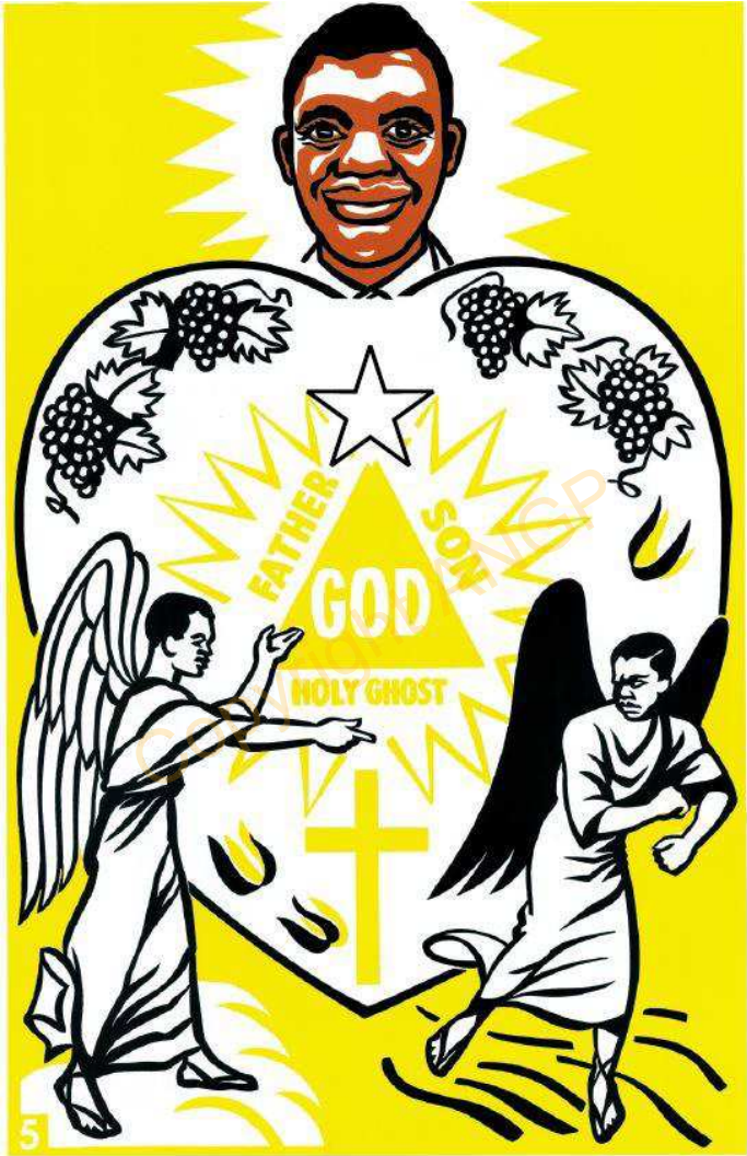
5. WURO TA KON.