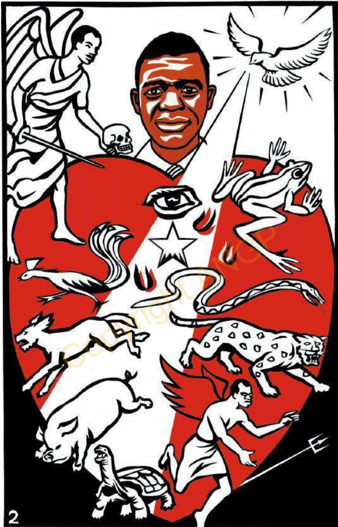
2. U MUTIMA UWASHININWA KABILI UWA KUNAKILILA