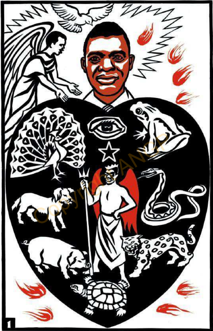
1. A YELBEBE SOB SUKYUR