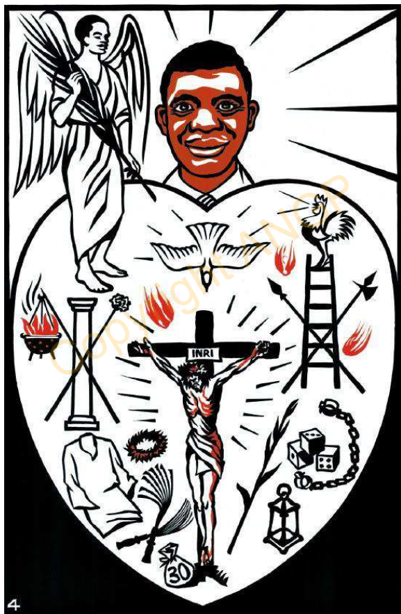
4. LANG KPIIRI YESU

"FU KPINA, EKYE A FU NYÖVUR WE N'A YESU ZIE." Col. 3:3