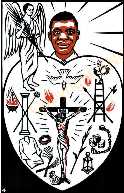
4. MɔGɔ MIN KɛRA I N'A Fɔ ALE NI KIRISITA GBENGBENNA NYɔGɔN Fɛ

“Ala ye ne tanga, ne kana ne yere bonya fenwere ra, m'a fɔ an Matigi Yesu Kirisita ta gbengben yere dɔɔn.” Gal. 6:14 “A ni Kirisita gbengbenna yiri ra nyɔɔn fɛ.” Gal. 2:20