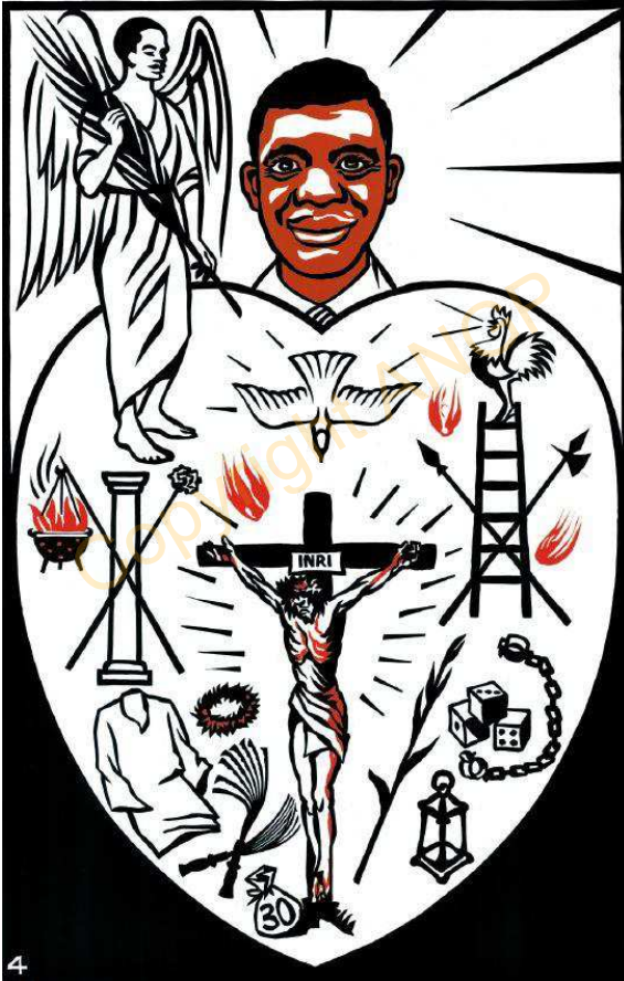
4. UHUOTO OHUNA

Osi vara oku yi vi do yara yi Ohomorihi, yi nozi ljeesu Kristi ananyi yi ni. Iromu 6:11.