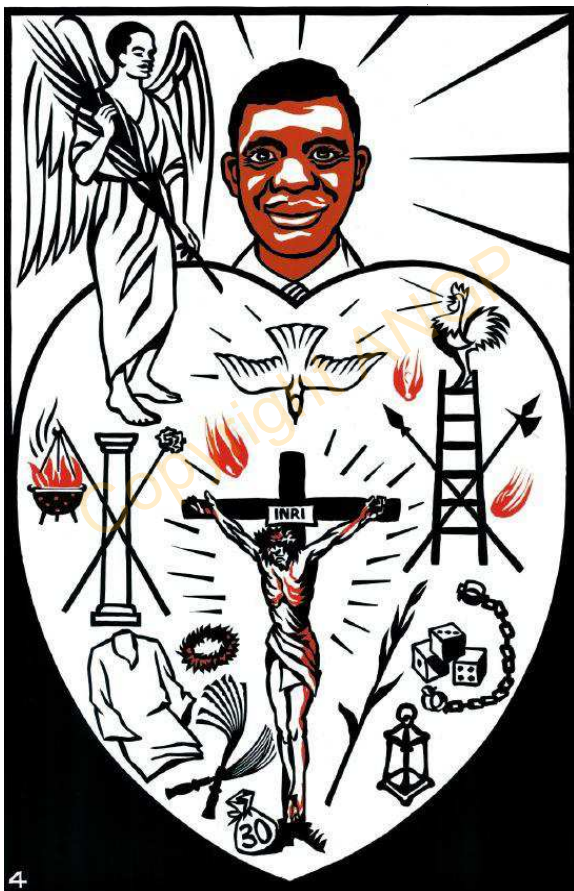
4. Ekpo âm na Krayis

Ekpin ejáné nji ebhú áji é kpo, Nji mfá-mfá á kí na Jisos Krayis mba Obhasi. (Ane Korose 3:3).