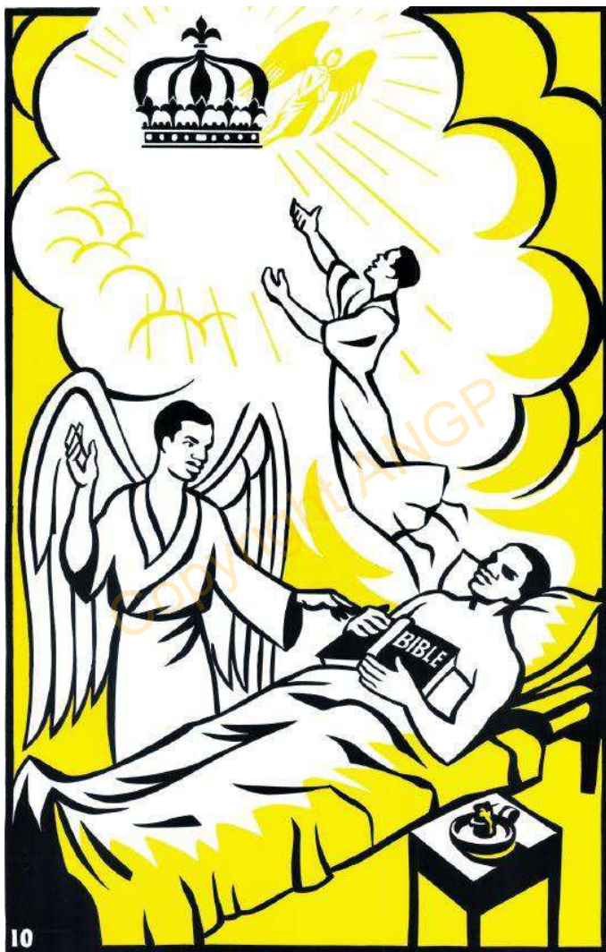
10. Ejiim eték Obhasi na ogyebhá-ńbáńé