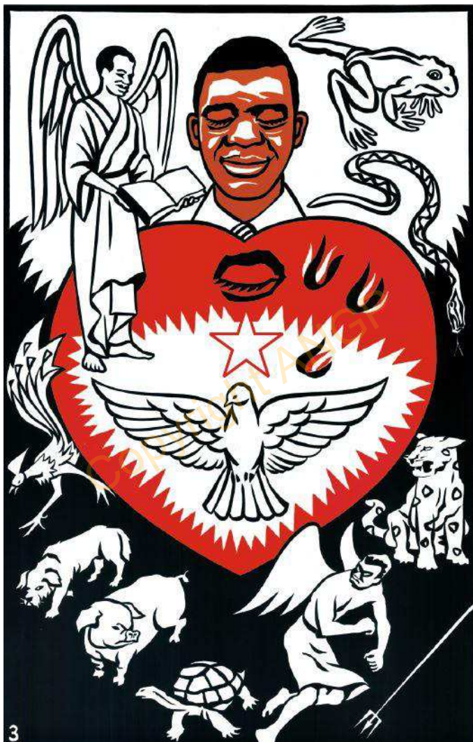
3. M'báné nnyi a maghe obhí