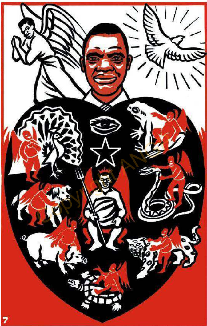
7. M̀báńé nnyí a r̀ń mbá a kam na Obhasi, kan a maghe