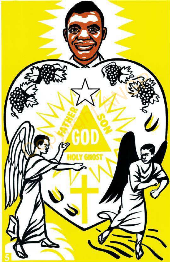
5. Ókúrí ahot Obhasi

Ono etónóm Onobhó-eji Okabhá-ńbáńé. Biji eserám Biji-efiím