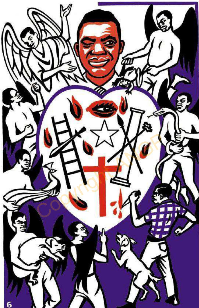
6. MFONIRI NI JI EKPAA