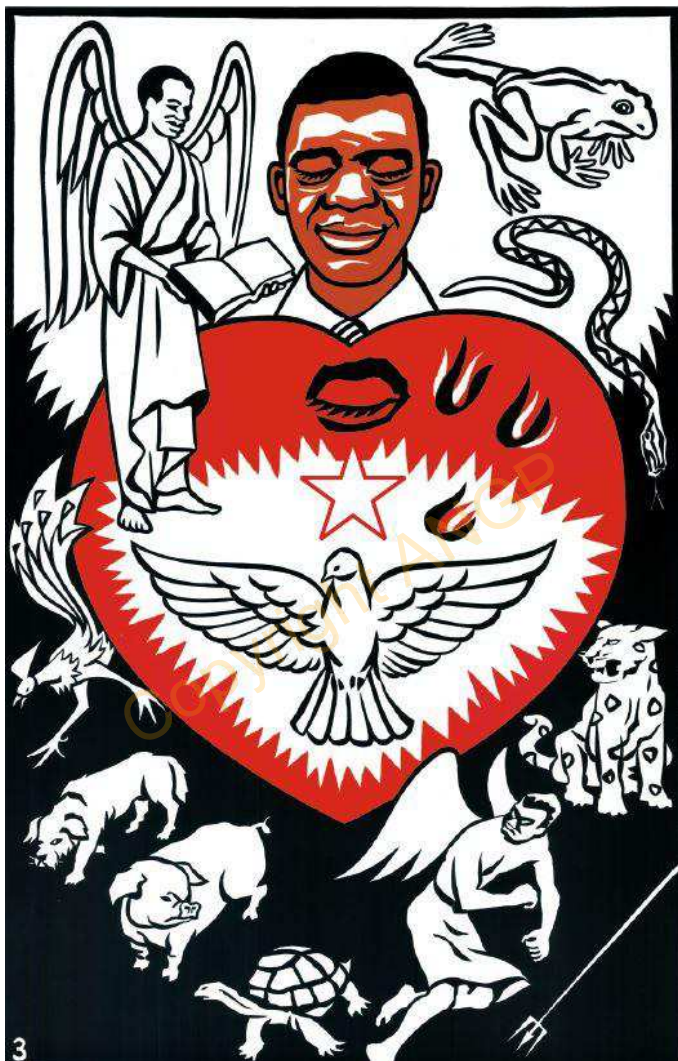
3. MFONIRI NI JI ETĒ