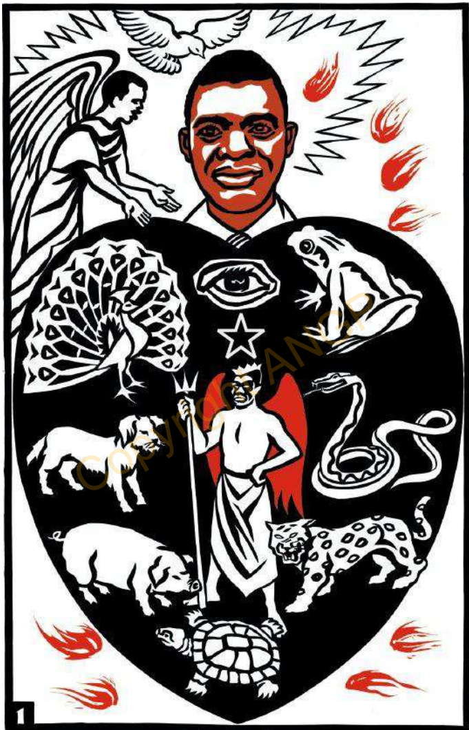
1. Etau a Ekasecan