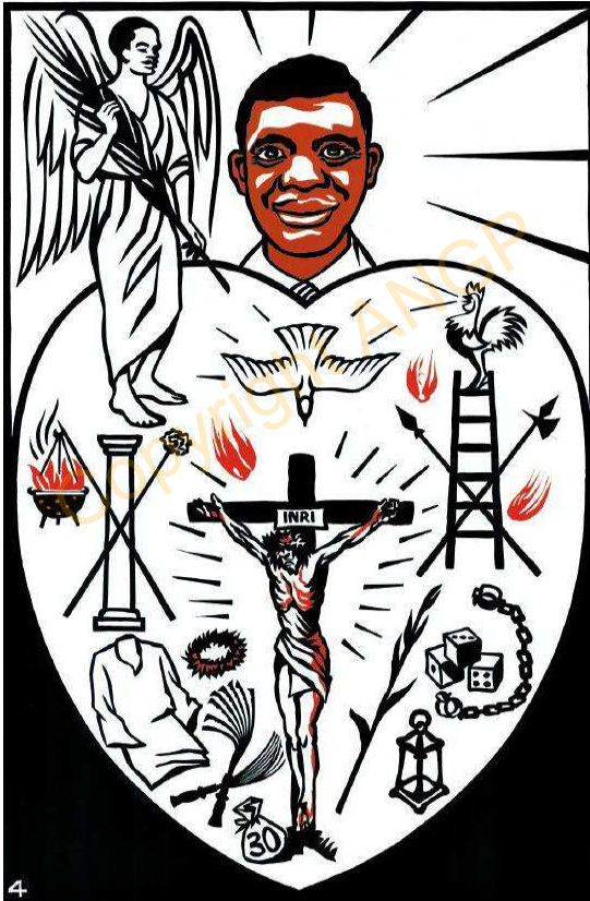
4. KUFWA ANDWAMERI NA KRISTO

"ANGU MOREFUEGE NA IRANGI JENYU JAVISWA ANDWAMWERI NA KRISTO KWA MLUNGU." Wakolosai 3:3