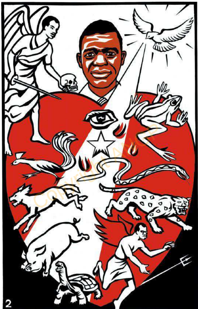
2. NGOLO ISEKUNDE KAUNG'A