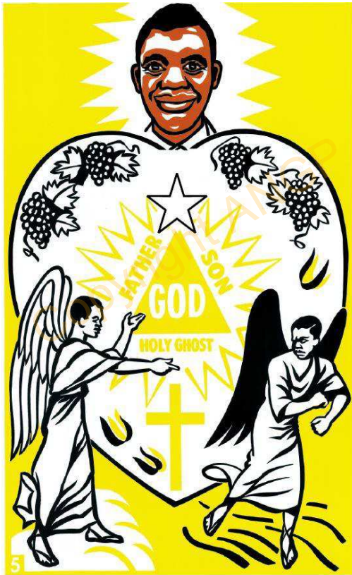
5. UTOB ANA UNDE TA KAFE PU WU KUSOG ANA RIMAM

AYIP RISI TI TI SEA IKENTI TINYANG TI TI NDE UTOB TI TI ROB UNDE TA KU NDUP WU RUSU BE UNDE TA KU YE SU RUSU WU