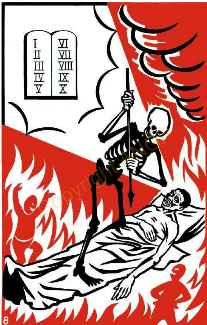
8. RUKWEN ANA UNDE TA KU NDE IKENTI ITIBI