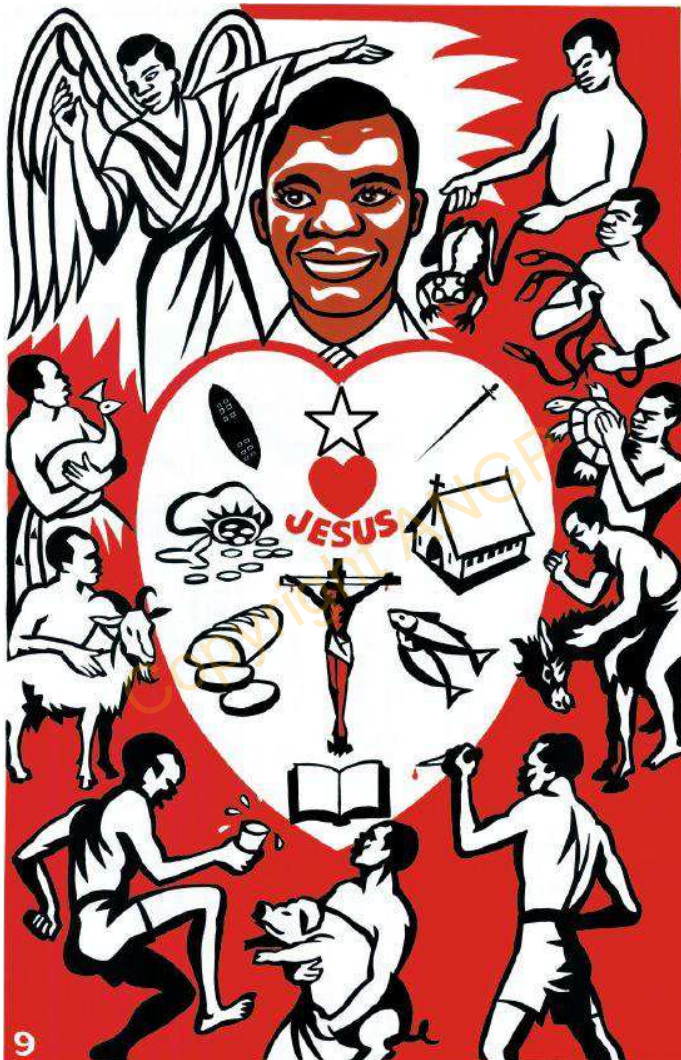
9. MANATE'E WANE NE'E TALARIUFIA IIRITO'ONGA