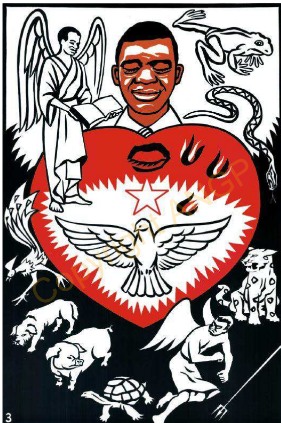
Eji ke le lōfūa

Le Mawu b'enyà be hēhlē ku yebe sese mea ele kpɔ yeḍokoe le Mawu b'apipia me, e le mōnuje ènti tutu alee yebe jì nyrō ḍoa ḍo ku agojèjèò. Ènuà le nō yebe jì eye fùlòkla gbādoà le na bele fāvi ḍo yebe nuvuēo ta. Mawu le gogoe.