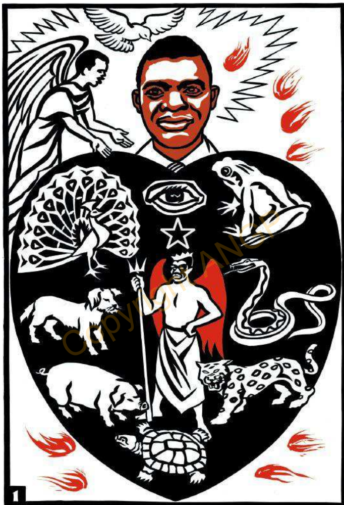
1. Pá' gie ntám nyiņ tepon wó