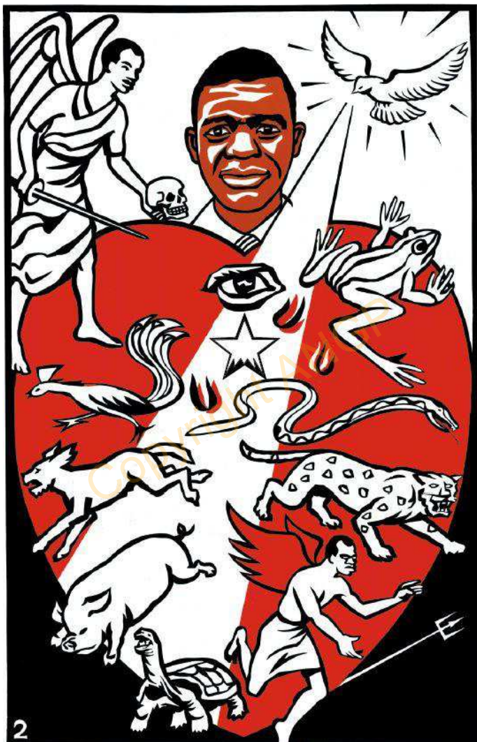
2. MTIMA WATATIKA KUSIYA VIWI