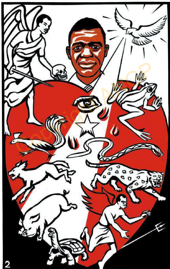
XOLUB BAKKAAR BUY WUT TEXE