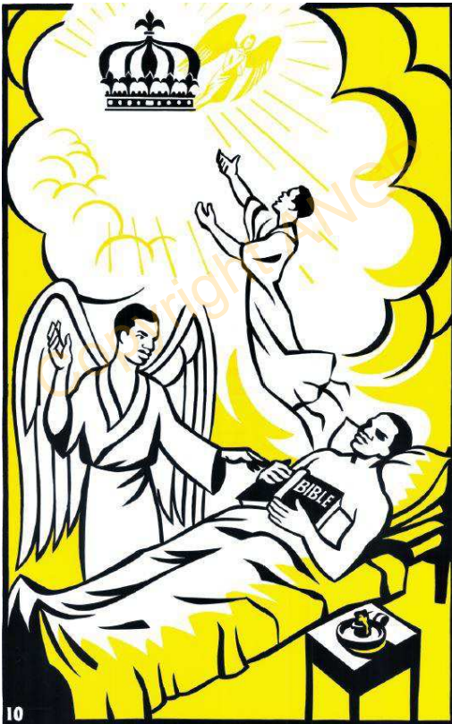
DUGGAL CI SA NDAMUL BOROOM