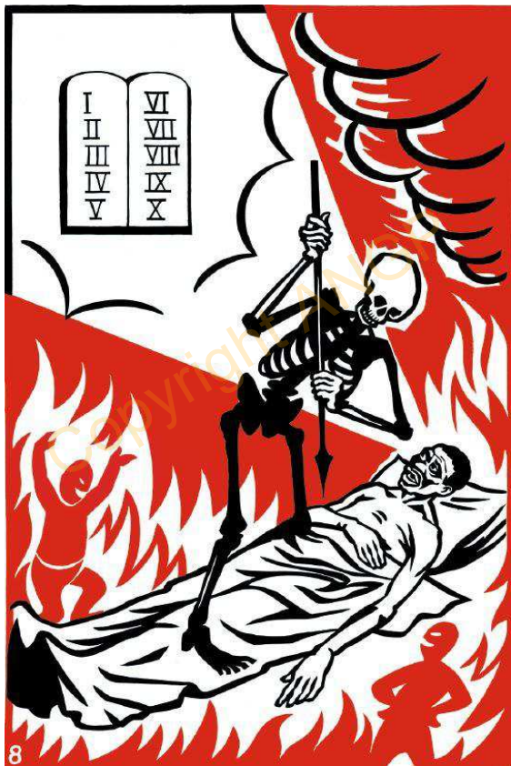
8. IDAJỌ ẸLẸŞE

Ibinu Aso Isote Adamo tabi Gboyisoyi Arankan