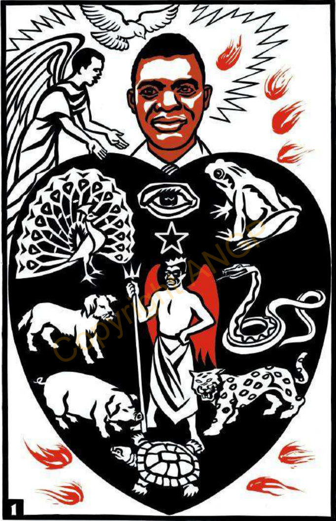
1. ÖKAN EŐEŐE