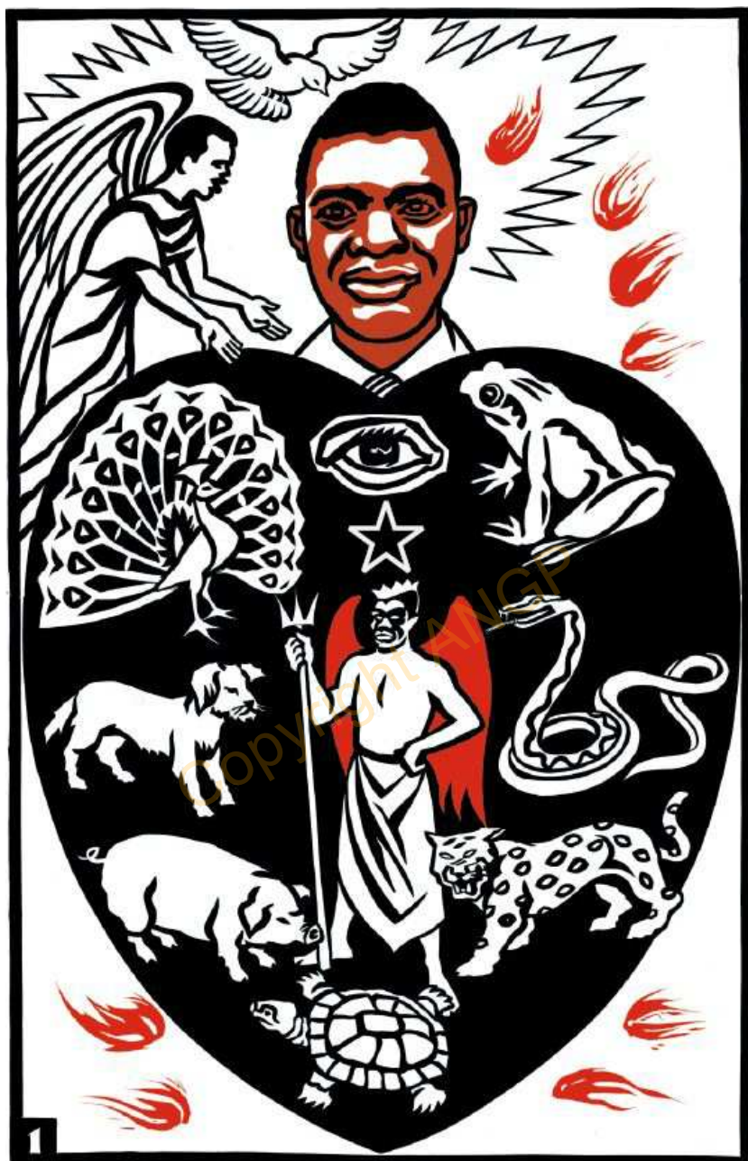
Foto N'Ga iklé blà ini yassoua awrimba, be coman assonou, Gnyamien flouwa flèbé satètèyéfouè, béyo niguétètè. Awrimba taissô