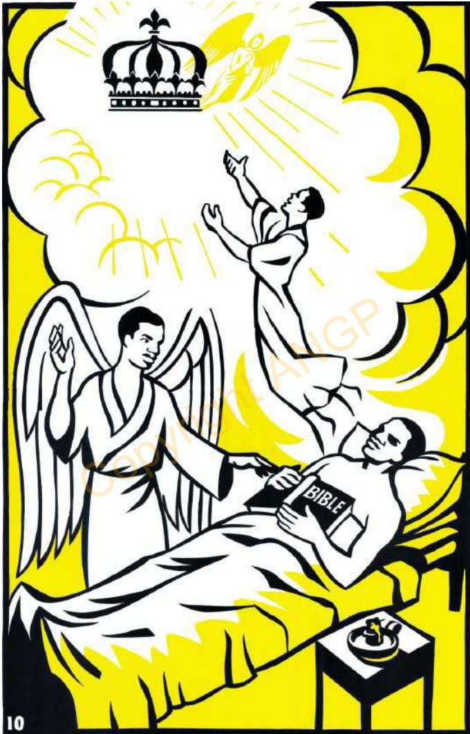
10. ZO O ISIRO 'BWABWAMU-