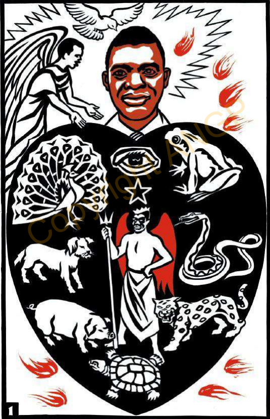
1. ASI 'BA E'YO ONZI 'YEPİRINI

tu atipi ewasi zuzuri 'i. Wura 'dori eri asi 'bani ece ada ada trotro ekile Munguni ndrelerile. E'yo O'beza 23:29—33 ece agu 'dori ma e'yo kilili, "A'dini awu wuni ya? A'dini ovu candi beni ya? A'dini ovu awata beni ya? A'dini agata beni ya? A'dini ovu ebi be ruaa e'yo kokoruni ya? A'dini ma mile ekaruni ya? Yi 'ba o'api ewa mvuzu sawa izu 'diyi, 'ba mupi patiefi su osazaru ndapi 'diyi. Mi lu patiefi su ku de eri ekaru, erini feria erejea ma aleni okazu i ma wurasi, erini siria e'yere varia. Te vutinia eri 'ba