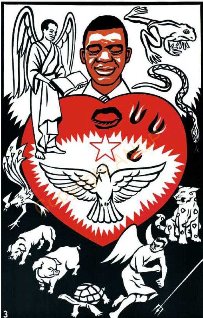
3. One ning tuba sunri a' si'em la