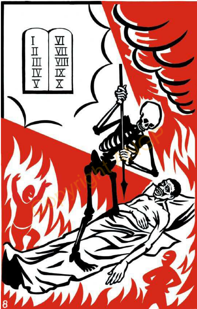
8. HEIE KU LUE SIA KWEI