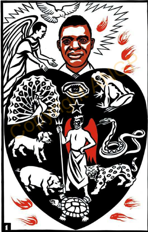
INDUMBULA YA NTULANONGWA

Pasi pantu gwa kifwani iki, indumbula ya mundu yikuboneka, mo fitugele ifinyamana fya fikolo fyosa, ifi fikunangisya ubutulanongwa bu bwi-