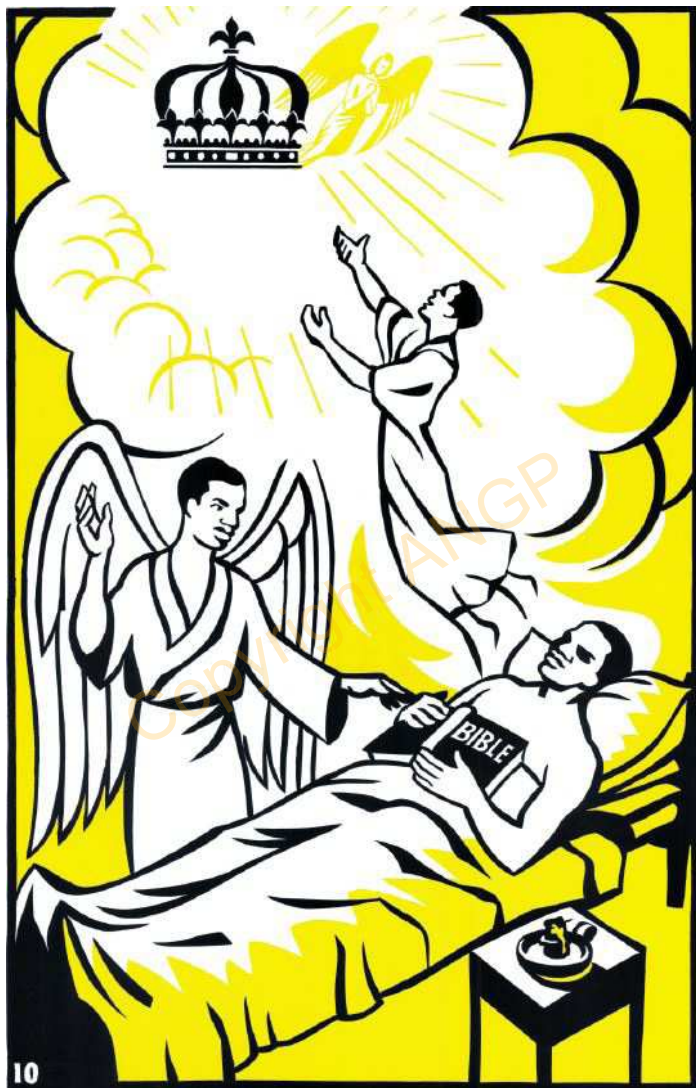
10. Utu naga i 'ba lo 'diko naga ku parara ina