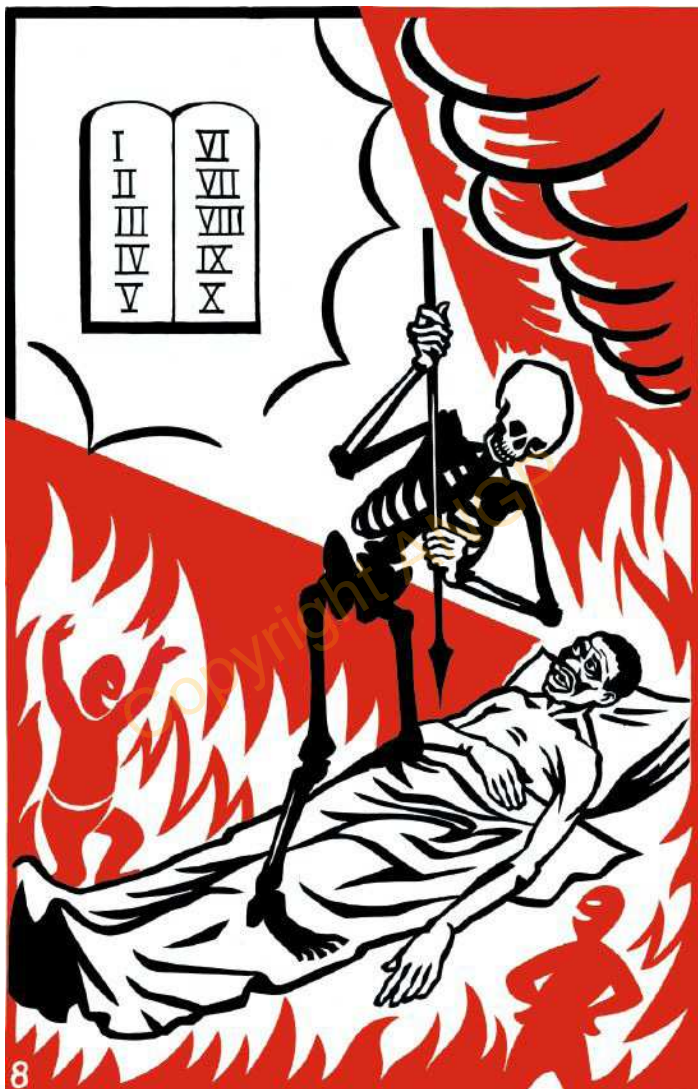
8. Kulia na nderaki katoronyanilo kine