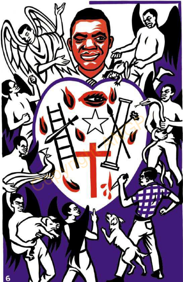
6. Teili lo ntu laga aluluka ku atokodya mugulo