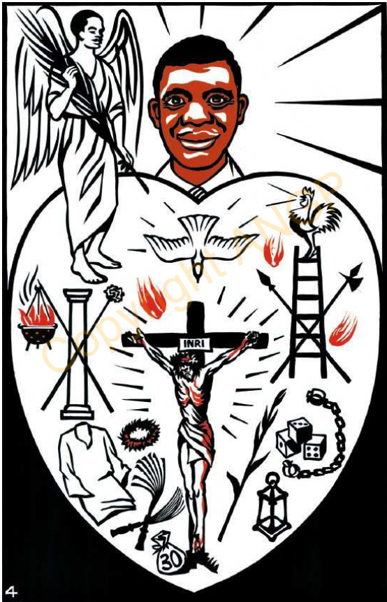
4. Tuwa naga ku Kristo kugelena

“Bo ta atatuwa azo, 'bo ru nasuna a'dana ku Kristo kugele ku Ŋun katani.” Kol. 3:3