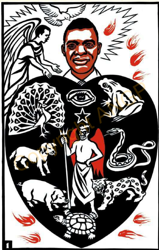
Foto atə karəgə kərdi-a bigəməbe-a fəlejin, kwanga au kamu dunyabe, tambo robe ba, ro dunyabe-a kuru məradəa-a kəragoa-a tigəbelan hogumtənamatə. Atə shima kutəram jire karəgənzəbego alama Alaye shiga suringai. Shimnzə