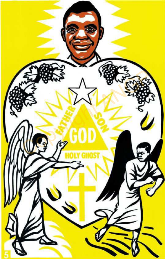
5. NZO NZAMBI

KIZUUNU KIVUMI BUNDEEMBU KUKULUKA Ngalatiya 5:22