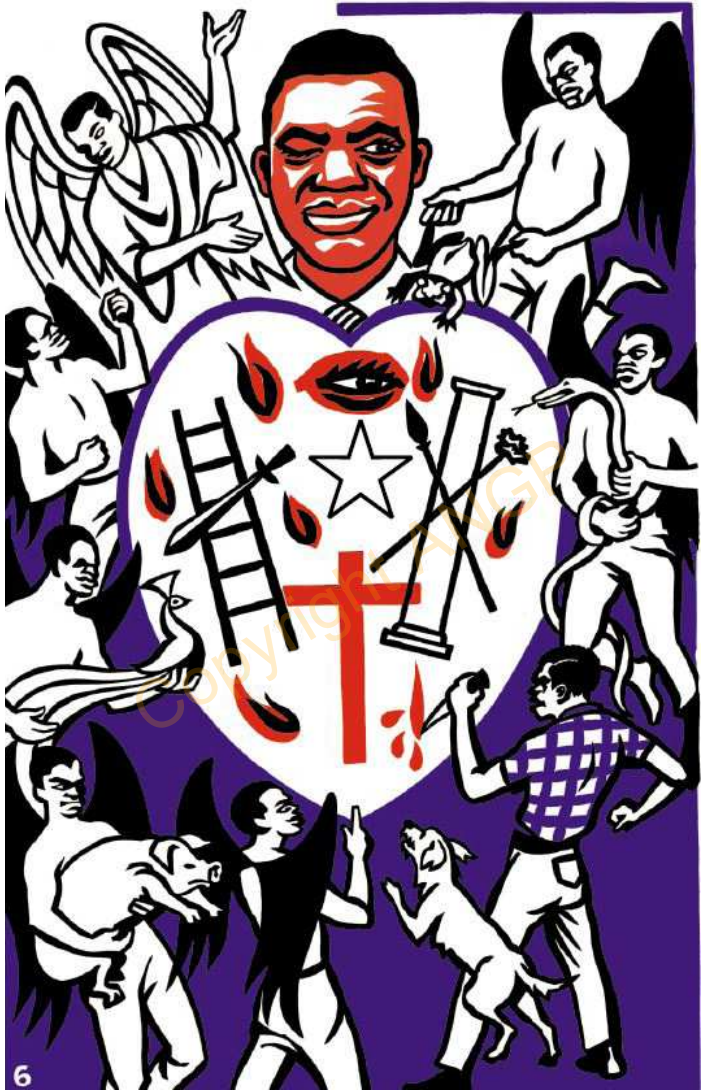
6. ME NĒKERE GE KAI DANA