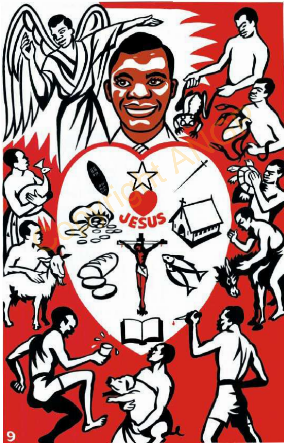
9. SONDOME NOORILA

fango sondomo keta sali bungo le ti. A ka ta sali bungo to wati-o-wati, adung ku buka wo bayi. A ye salo kanu kabiring sali bungo to fo ala suwo kono waranto a fango la bungo kono, katu a y'aa long ne ko lannamo te tara no la a ning Alla mang kacha salo kono.