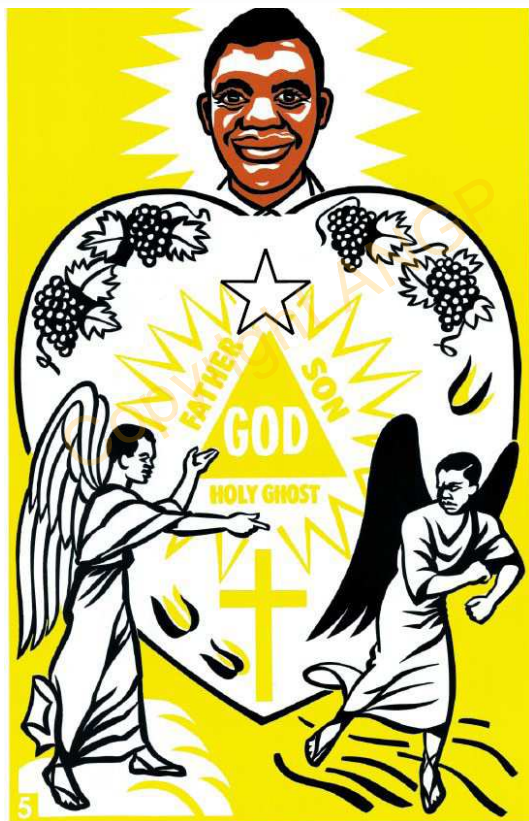
5. ALLA LA SALI BUNGO

kumo fanang ka tara ate le ye" ( Yohana 15:1 ). Kabiring a tinmata, a ye Baptiso soto Nora Kulingo la, a ye sembo soto le jaato ning ala filo no, wo ning ka ke baake no bantambilo kang. Nora Kulingo sembo kang, a ye kuwo bee no, katu a ka tama noro le la. A buka tuuku feng na, a ye meng je, a ye meng moi waranto aye meng long a fango fee; a ka tuuku limaneya dorong ne la,