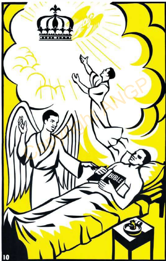
10. ARIJANA TA SEWO

Kang te kering duniya mo si nemo misali no meng na, Alla ye nemo meng parendi arijana kono, molu ye menu ye Eesa sinno noma duniya kono.