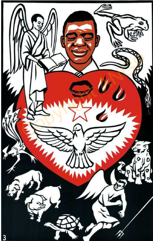
3. SONDOME TUBILA

la le” ( Yohana 3:16 ) katu nga daha ning junube kafaro soto Eesa yelo le la, ko a nemo be sabatiring nyameng” ( Efiso 1:7 ). Jato meng filita junubo la nung, wo nata hamengo soto ka balu Alla ye, aning ka Alla batu. “Meng folo ye N kanu” a mang duniya ning duniya fengolu kanu, a ye Alla ning Alla la fengolu le kanu.