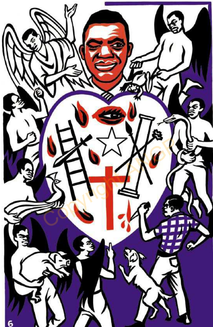
6. Akikè èntijj e bə àghàbètè la