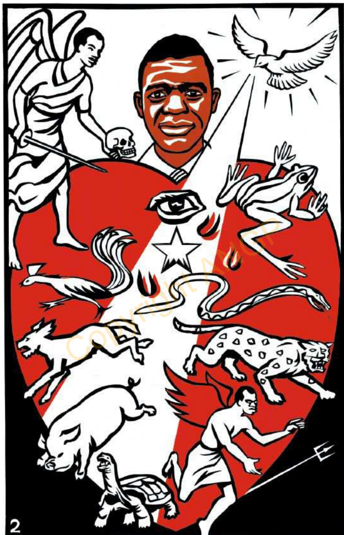
2. Èntij e bijne a kàbòŋ vi la