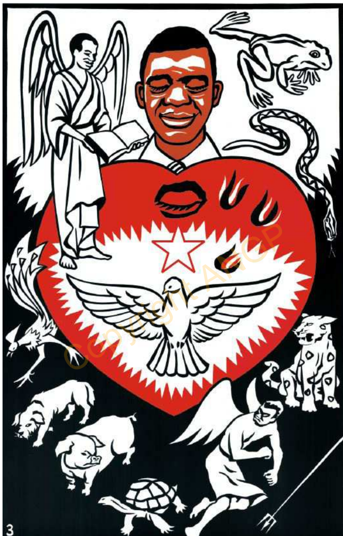
3. Èntijj e wa'a kàbòh vi la