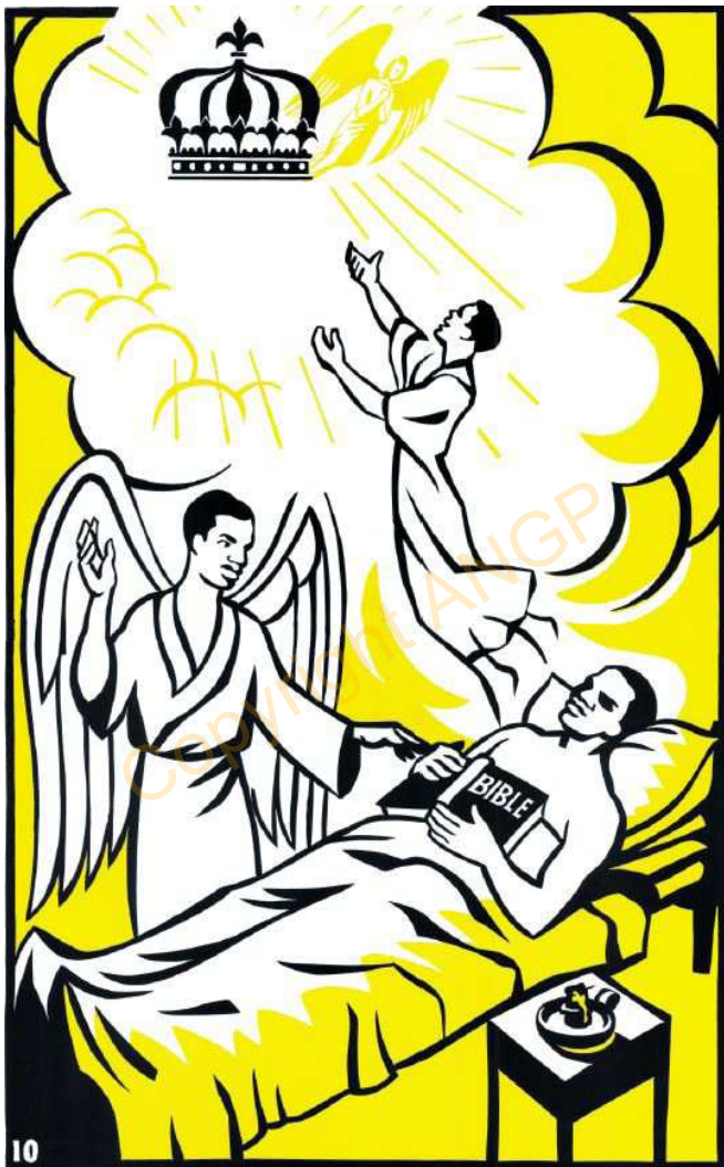
10. KUHIEKELA KU YINZO YA ULAMBA