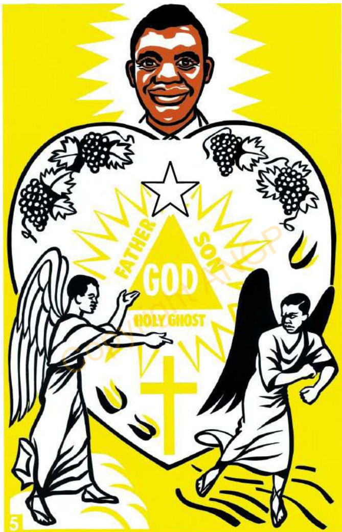
5. Riba di nghe'ren Krist y'a ghebi