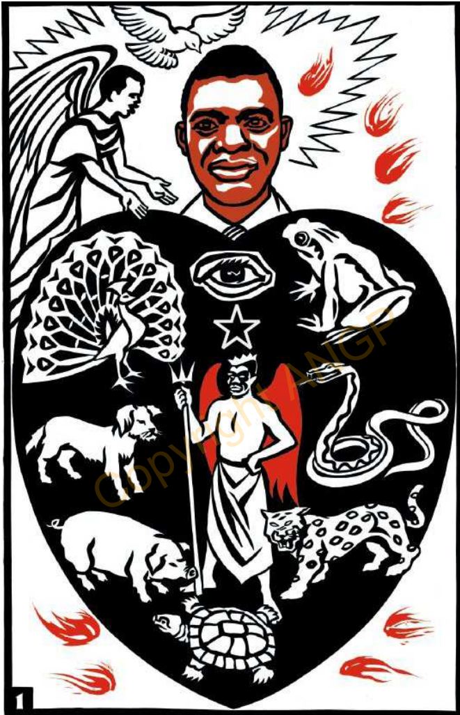
1. NGUḌUFA MNDA DƏMAKU