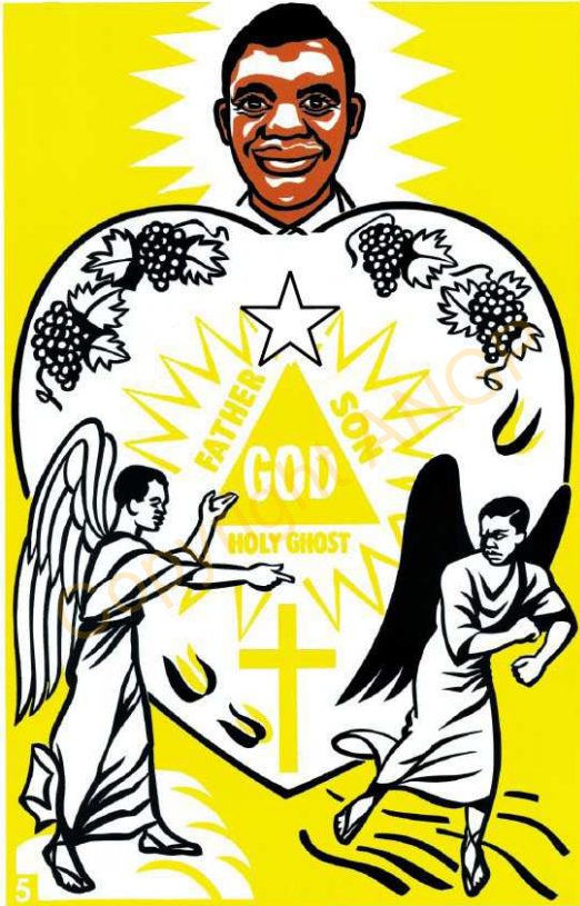
GU BISUE IMAGE

nabi ni bangirini te, na gu ni nagia ha a te, ono ni nara mbiko idapase; bambiko idapa Yesu Kristo nga gu pai nafu diabese na diabe zegino a fu ni. Ni nara mbiko idapase ki du ni nyakasinyakasi ni mbiko gu unga maabangirise nga pa yega Yesu Kristo. Ni nara mbiko ga Mbori nyemuse nanye anye kindi.