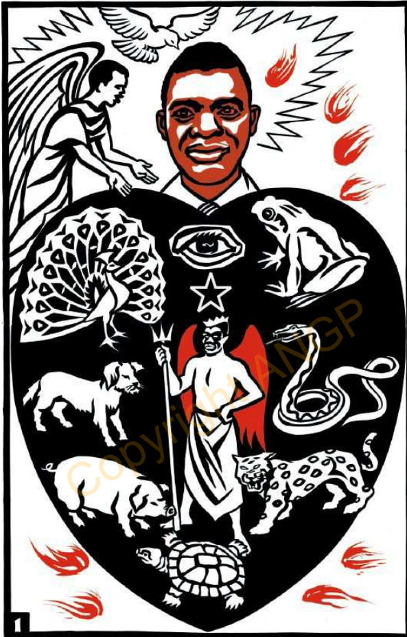
FOTO NOMBOLO 1

Lo foto kombisa tina lo nhliziyo ka lo muntu ka lo mhlaba lo yena enza lo sono, na lo moya mubi yena tshova yena stelek. Manje lo foto kombisa tina lo nhliziyo fana lo Nkulunkulu Yena buka lo nhliziyo. Lo bomvu mehlo yena komba lo muntu lo yena puza lo tshwala. Proverbia 23:29; Izaga 23:29. Ubani to-