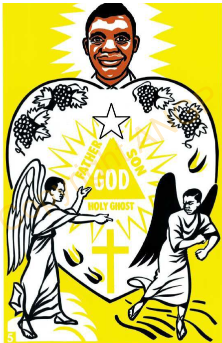
LO FOTO NOMBOLO 5.

Pata kahle, muhle, helepa, ai kona pakamisa.