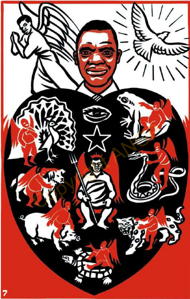
7. እጊ ኤብር ዌም የድረተረ ሽን