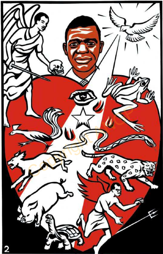
2. ባጠረተህ የክረ ኸማ ያመረ ኸን።