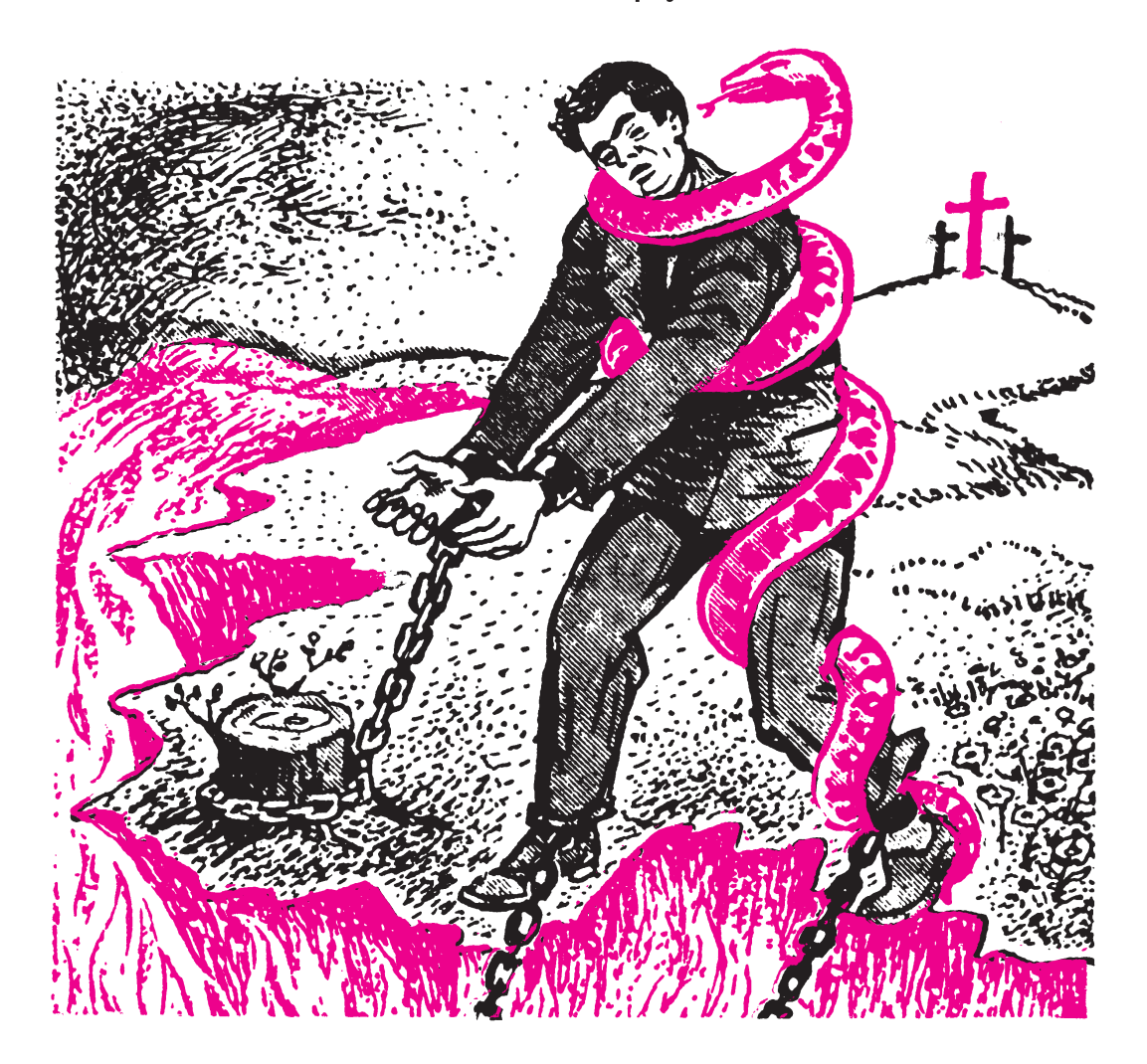
जेनकोन पाप करुआत, उन शैतान चो और आए। 1 यहून्ना 3:8