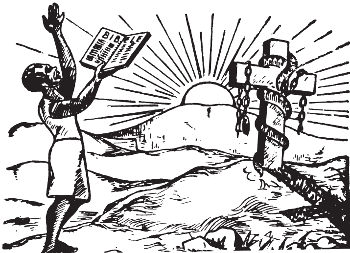
Ka ruu nōngkò, jaa nēe yaa ṅoo naa ṭò zang yaa ṅoo ṭò dondong. (Yohanna 8:36).

Yeeso jaa Kpanti Laa tuu vuu shi kpang ḁuru ṭò ka ḁoo zang ḁaa wu naa ka laa ḁee. Zang ḁaa rēe vuu shi kpang ḁuru ṭò nēe jīng dangne ḁuru.... A zang shing wu nyaa vu waa ka bii ka ruu vuu shi kpang ḁuru, jīng dangne ḁiḁe kò shingne ruu nwang ka nyaa zò ṭò. A ḁoo nyaa risi ḁoo ka biī ḁiḁe kò shingne kōnang ḁuru yaa ruu. (Ishaaya 42:7).